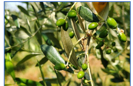
Fase fenologica-areale Garda

Attualmente non si ritiene siano necessari interventi fitosanitari .